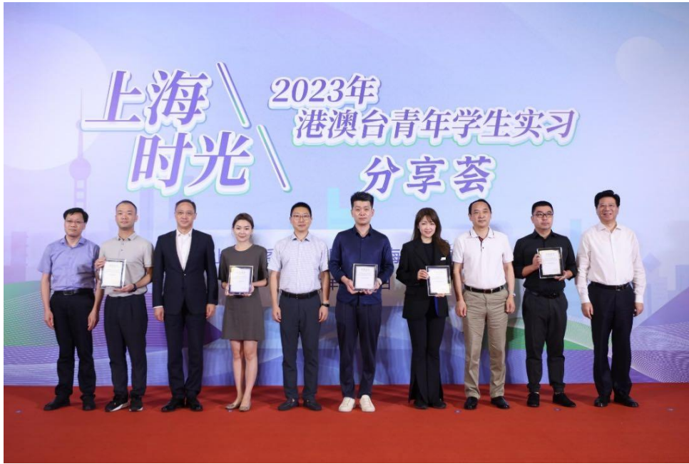
图注：上海分行获评“2023 年港澳台青年学生实习计划示范企业”荣誉称号

2023 年 3 月，福州分行参与鼓楼区青邻帮助你促进会开展“青邻公益 情暖校园”爱心捐赠活动，为鼓楼实验小学捐赠 22 台一体机；6 月，福州分行前往福州市晋安区启智学校开展慰问活动，参与学生美术作品义卖。