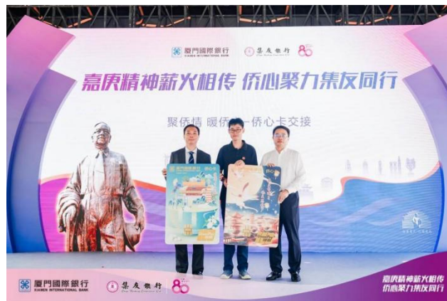
图注：正式发布华侨金融主题卡“侨心卡”

全力践行惠侨宗旨，累计推出 50 亿元华侨专享贷款，推出华侨贷、侨康贷、侨税贷、侨安贷、侨抵贷等专享信贷产品；先后发行数十期华侨专享理财产品，为侨胞侨企提供丰富多样理财选择；正式发布华侨金融主题卡“侨心卡”，为侨胞打造专属借记卡；落地福建省首笔侨汇结汇便利化试点业务。