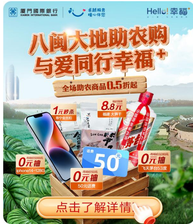
图注：“八闽大地助农购，与爱同行幸福+”助农直播