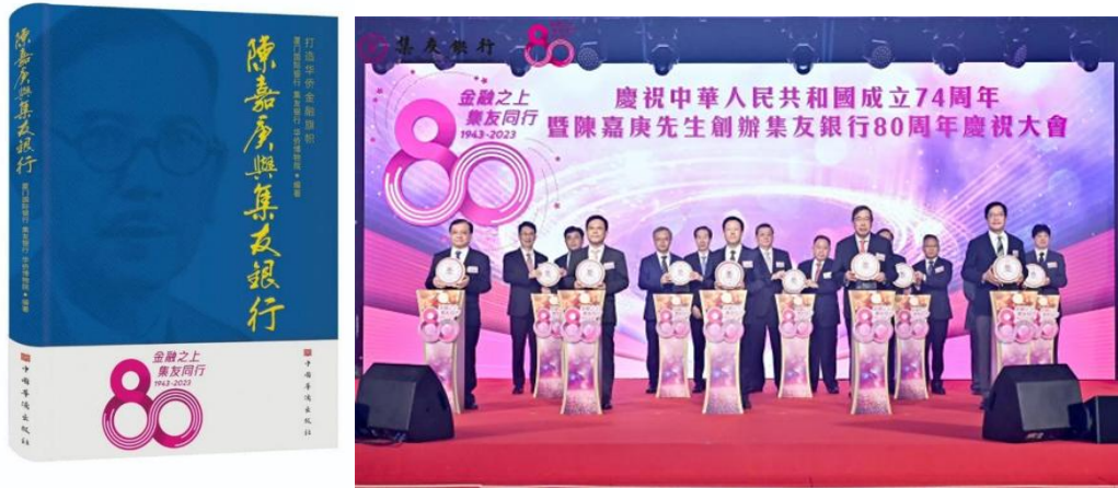
图注：庆祝中华人民共和国成立 74 周年 暨陈嘉庚先生创办集友银行 80 周年庆祝大会在香港举行