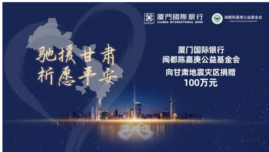
图注：我行携手闽都陈嘉庚公益基金会向甘肃地震灾区捐赠 100 万元

2023 年 9 月，我行携手闽都陈嘉庚公益基金会向厦门市红十字会捐赠 100 万元，专项用于河北洪灾地区灾后重建、复工复产等工作，助力灾区群众重建美好家园；12 月，甘肃临夏州积石山县发生 6.2 级地震，我行携手闽都陈嘉庚公益基金会向甘肃地震灾区捐赠 100 万元，紧急拨付支援甘肃地震灾区，包含价值 20 万元的抗震救灾物资，以及向临夏回族自治州慈善协会捐赠的 80 万元爱心款项，助力甘肃灾区抗震救灾。