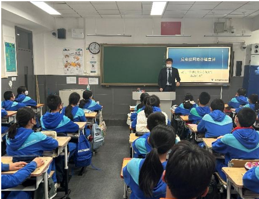
图注：2023 年我行开展金融知识进校园活动

打造“线上+线下”“集中性+阵地性+常态化”“传统媒体+新媒体”金融知识宣教网络，开展“3·15”金融消费者权益日活动、“‘3·15’消费者权益保护教育宣传周”“普及金融知识万里行”“金融消费者权益保护教育宣传月”行业集中宣传活动；常态化开展送金融知识进社区、进企业、进校园等活动，将消费者权益保护宣传教育工作与党建共建、志愿者服务等相结合，推动“党建+消保”走深走实；推进“以案说险”及“消保微课堂”系列金融风险消费提示等自主宣传活动。2023 年累计开展 471 次线下集中宣传活动，制作发布 95 份原创金融知识宣传资料，宣传活动累计触达消费者约 288 万人次。