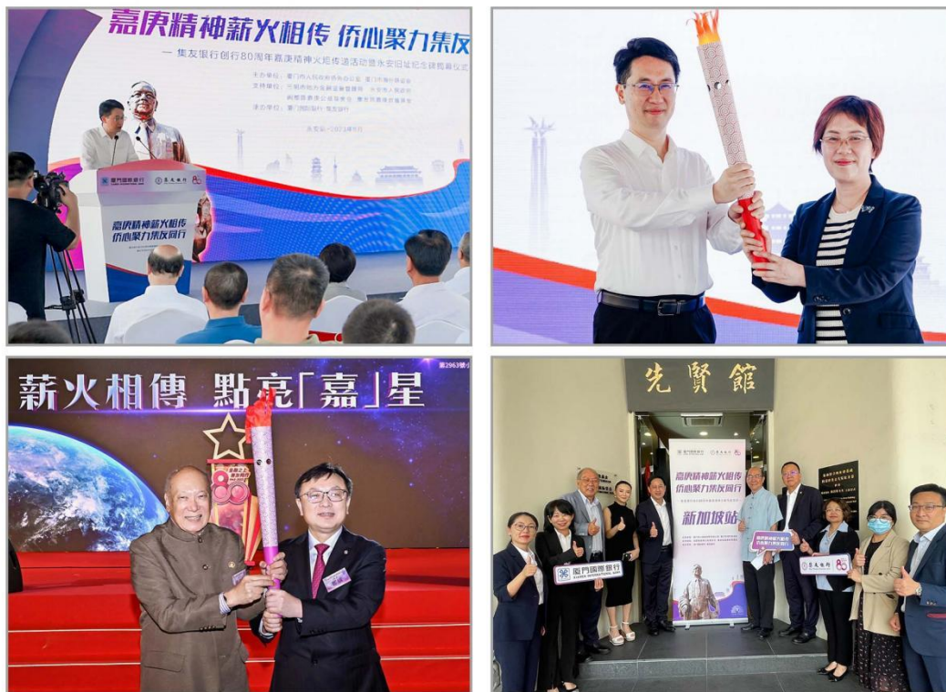
图注：嘉庚精神火炬传递，12 城接续燃动神州