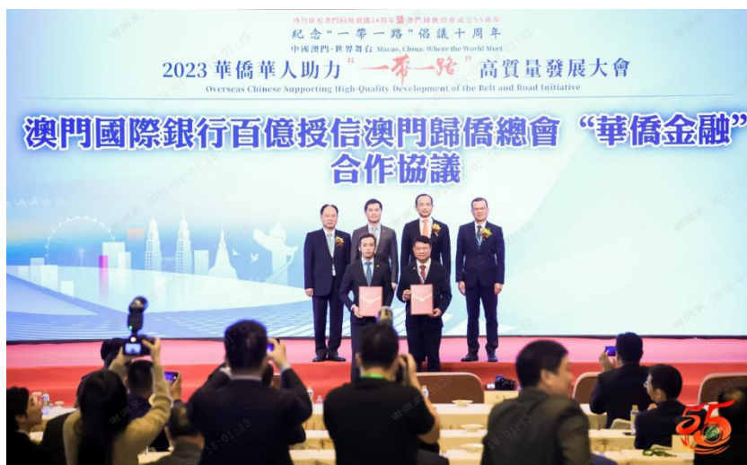
图注：澳门国际银行与澳门归侨总会签署“华侨金融战略合作协议”

2023 年 11 月，在“2023 华侨华人助力一带一路”高质量发展大会上，澳门国际银行与澳门归侨总会签署“华侨金融战略合作协议”，以“侨”为桥，共同服务境内外华侨华人，树立区域合作典范，助力澳门经济适度多元发展；6 月，与澳门福建同乡总会签订金融服务澳门闽籍乡亲战略合作协议，共同促进闽澳“并船出海”，携手服务国家“一带一路”战略。