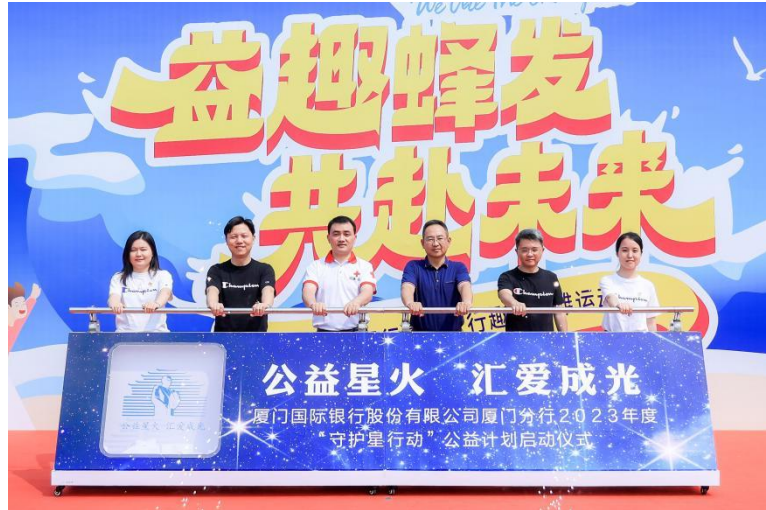
图注：厦门分行与爱心单位共同开启“守护星行动”公益计划

2023 年 6 月，珠海分行向中山大学国际金融学院捐赠 20 万元设立“厦门国际银行嘉庚发展基金”，资助困难学生、奖励优秀学生，改善学院办学条件。