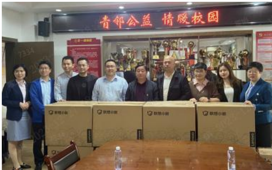
图注：福州分行参与鼓楼区青邻帮助你促进会开展“青邻公益 情暖校园”爱心捐赠活动

2023 年 3 月，福州分行参与鼓楼区青邻帮助你促进会开展“青邻公益 情暖校园”爱心捐赠活动，为鼓楼实验小学捐赠 22 台一体机；6 月，福州分行前往福州市晋安区启智学校开展慰问活动，参与学生美术作品义卖。