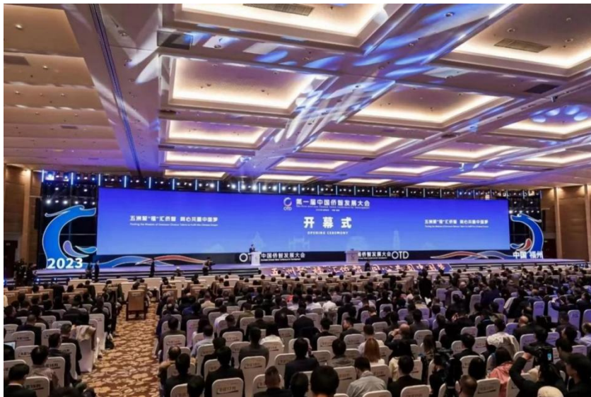
图注：我行亮相第一届中国侨智发展大会