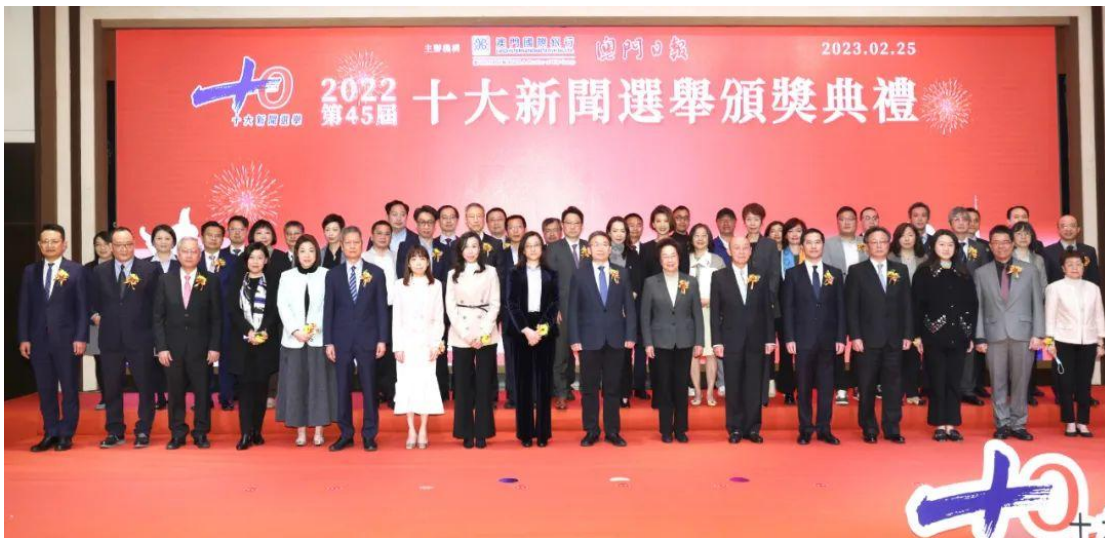
图注：澳门国际银行与澳门日报联合举办第 45 届澳门“十大新闻选举”活动 2023 年，厦门分行联合厦门市中心血站协同开展多场无偿献血活动，邀请

2023 年，澳门国际银行与澳门日报联合举办第 45 届澳门“十大新闻选举”活动，举办第 29 届“澳门国际银行全员捐血日”，组织广大银行员工参与捐血，荣获澳门特别行政区政府卫生局团体捐血推动奖；12 月，集友银行参与由香港南区香港仔街坊会举办的“南区寒冬送暖大行动 2023”活动，为独居老人送去关怀；为庆祝中华人民共和国成立 74 周年，集友银行支持并组织员工参与九龙乐善堂及九龙城民政事务处联合举办的“国庆乐善减塑启 Duck Run”活动，以展现集友银行爱国爱港、关爱社会、支持环保及慈善的企业文化精神。