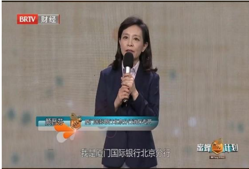
图注：2023 年北京分行参加 3·15 金融特别节目