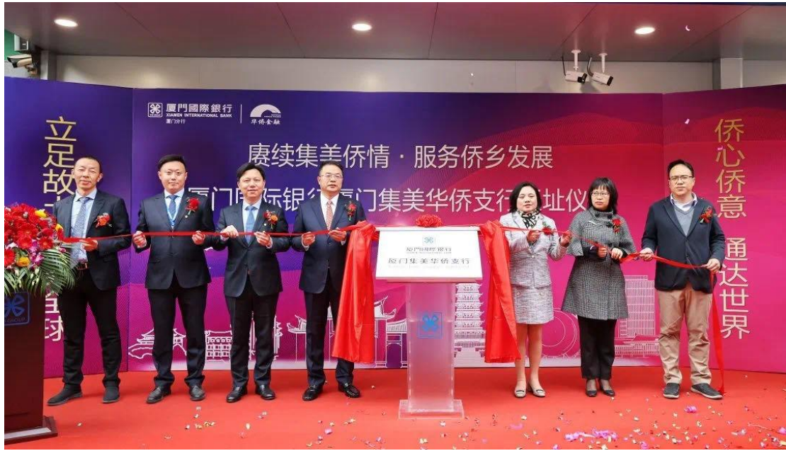
图注：厦门集美华侨支行焕新迁址