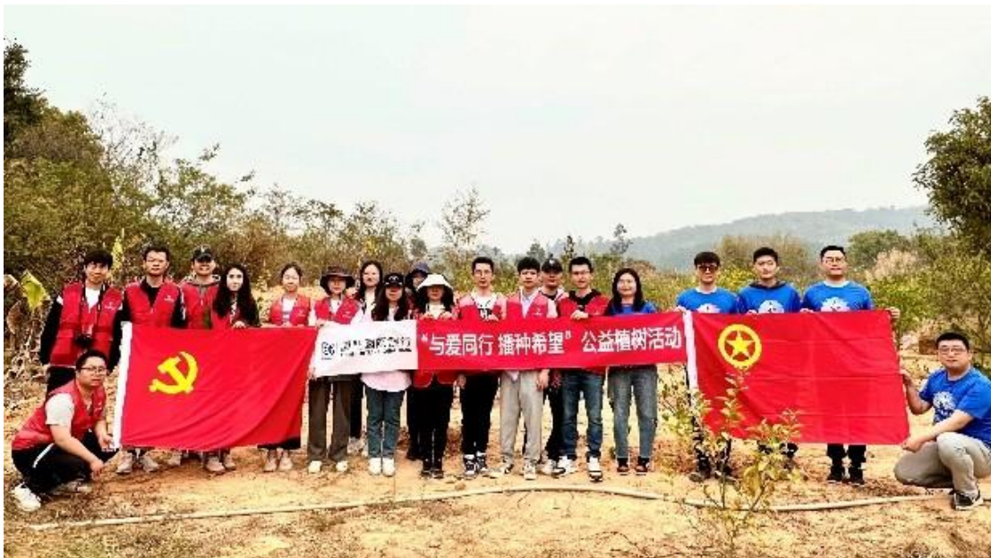
图注：厦门分行团委联合厦门市智力残疾人及亲友协会举办