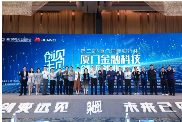
图注：“厦门国际银行杯”厦门金融科技创新创业大赛

成立“数字化发展与客户旅程转型委员会”统筹全行数字化转型工作；建立科技创新项目孵化机制，实施敏捷化改革，逐步设立了普惠金融工作室、公司金融数字化办公室、数字员工工作组、智慧应用工作组、客户旅程工作组等业务与科技高度融合的敏捷团队；建立“科技派驻机制”加强总分行科技与业务融合；广泛开展银企、银校、银政、银银合作对接，与头部金融科技开展深度合作，构建一系列产学研联合创新实验室，连续举办四届“数创金融杯”建模大赛、三届“厦门国际银行杯”厦门市金融科技创新创业大赛，推动金融科技创新创业浪潮。