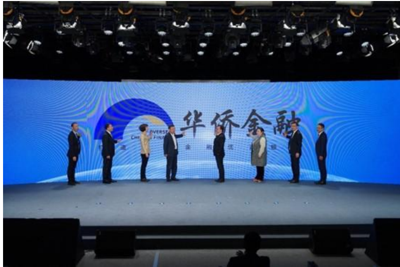
图注：我行承办首届华侨金融助推高质量发展论坛