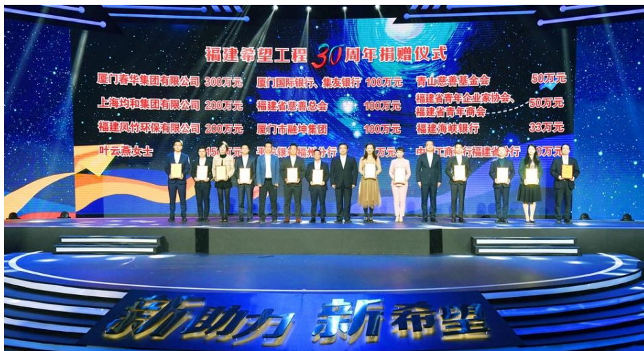
图注：我行与集友银行向福建希望工程捐赠 100 万元

向澳门福建学校、澳门教业中学、澳门浸信中学等当地中小学校捐赠奖助学金。6 月，集友陈嘉庚教育基金向香港理工大学、香港珠海学院各捐赠港币 100 万元设立奖学金。