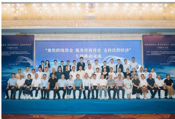
图注：开展华侨金融主题活动，走进侨乡服务侨商侨企

2023 年 11 月，在“2023 华侨华人助力一带一路”高质量发展大会上，澳门国际银行与澳门归侨总会签署“华侨金融战略合作协议”，以“侨”为桥，共同服务境内外华侨华人，树立区域合作典范，助力澳门经济适度多元发展；6 月，与澳门福建同乡总会签订金融服务澳门闽籍乡亲战略合作协议，共同促进闽澳“并船出海”，携手服务国家“一带一路”战略。