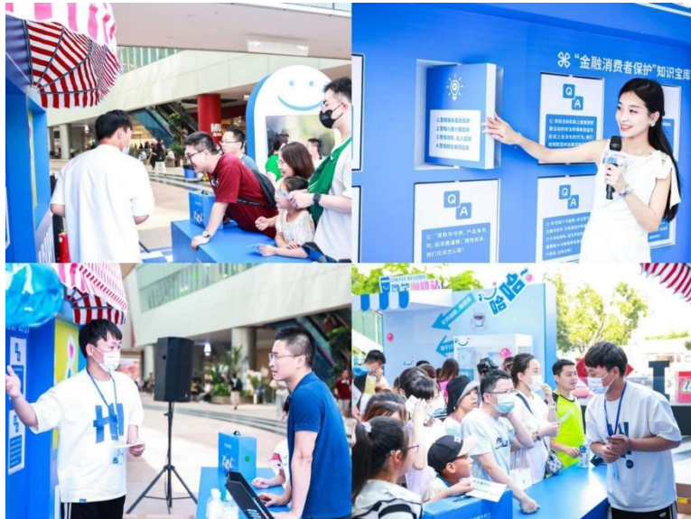
图注：我行“城市微笑加油站”活动在厦门、上海、珠海等多城市接力举办

2023 年，我行在服务品牌建设领域持续深耕创新，发布以“微笑”为主题的年度服务品牌宣传片《到微笑里去》，视频触达人群超过 160 万，引发社会情感共鸣，取得良好口碑；在厦门、上海、珠海、福州等分行所在城市策划举办线下城市微笑加油站品牌传播活动，线下吸引近万名当地市民热情参与，使“金融为民”理念和微笑 logo 超级符号深入人心，荣获第十六届时代营销盛典年度品牌价值传播奖。