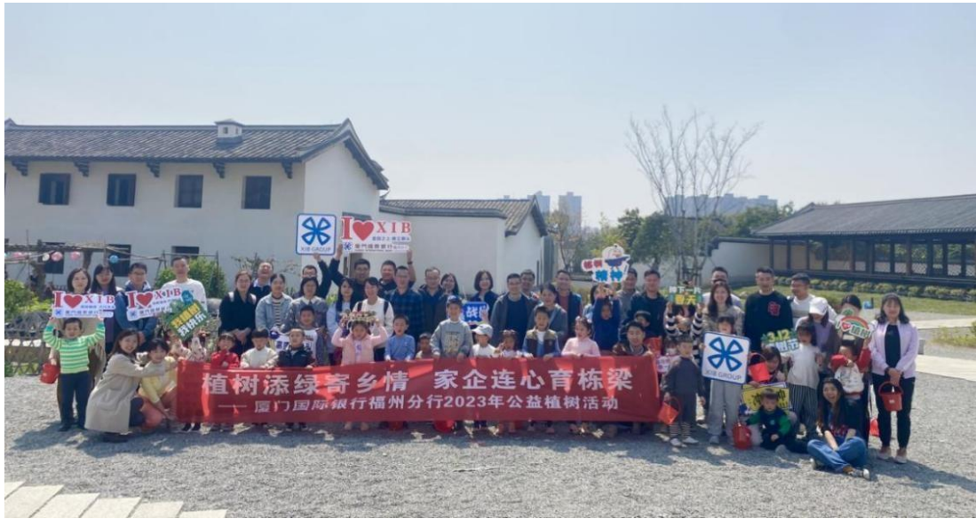
图注：福州分行开展“植树添绿寄乡情·家企连心育栋梁”公益植树教学实践活动