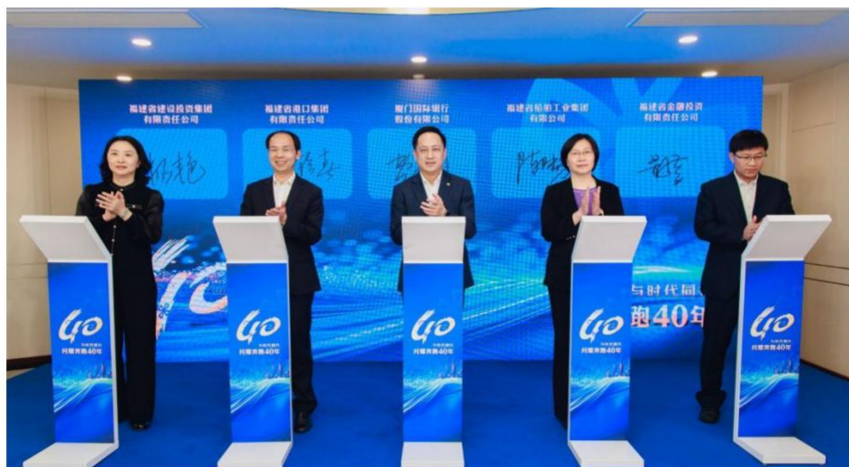
图注：2025 年 4 月，我行举办“共聚闽商之力，启航战略新篇——厦门国际银行与福建省属国企战略合作协议签约活动”

2025 年，我行以“共聚闽商之力，启航战略新篇”省属国企战略合作签约活动为起点，拉开四十周年战略客户合作的序幕，推进 40 余家战略客户签约落地，以深耕本土、联动港澳的金融担当，为区域高质量发展注入强劲动能，开启服务国家战略、助力新质生产力培育的全新篇章。