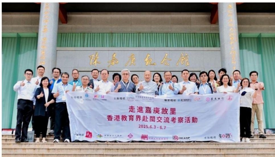
图注：2025 年 6 月 3 日，我行参与举办“嘉庚心·中华情 走进嘉庚故里——香港教育界赴闽交流考察活动”

2025 年，我行出版的《陈嘉庚与集友银行》一书入选香港特别行政区教育局“历史科电子阅读奖励计划 2025”；成功举办“嘉庚心·中华情 走进嘉庚故里——香港教育界赴闽交流考察活动”、首届“嘉庚大讲堂——如何透过人物故事传递价值观”活动，支持举办华侨主题大型舞剧《海的一半》，该剧以陈嘉庚先生为原型，演绎其艰苦创业、倾资兴学的光辉历程，全网话题阅读量超 1 亿次，视频播放量突破 3 亿次，生动诠释嘉庚精神的时代内涵。