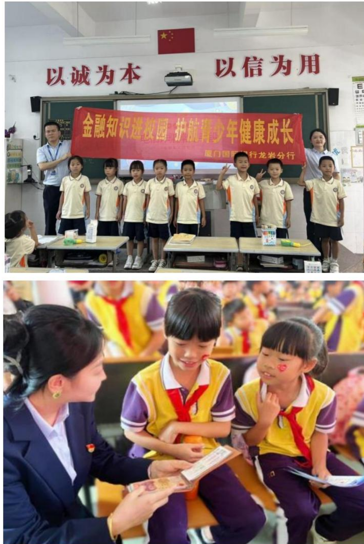
图注：我行各分行积极开展教育公益活动