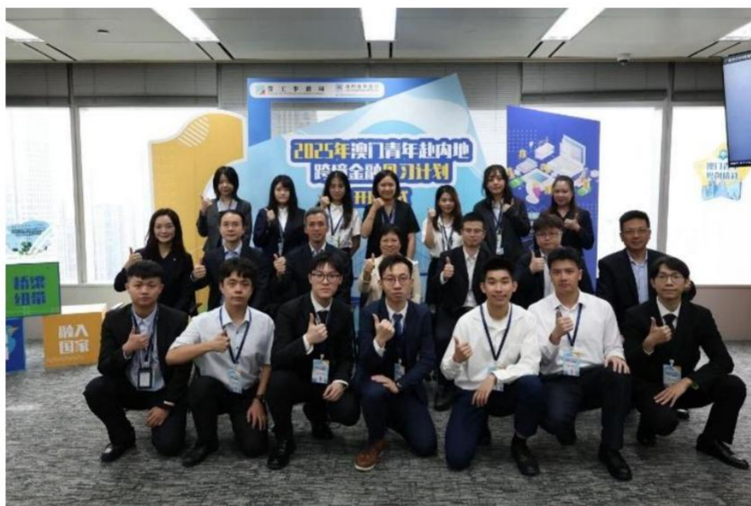
图注：澳门国际银行推出澳门青年赴内地跨境金融见习计划