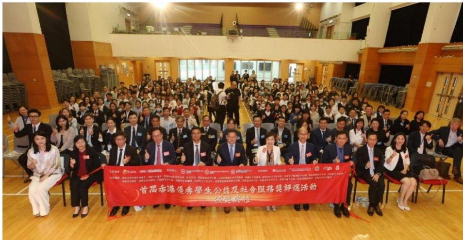
图注：集友银行支持举办首届“香港优秀学生公益及社会服务奖”