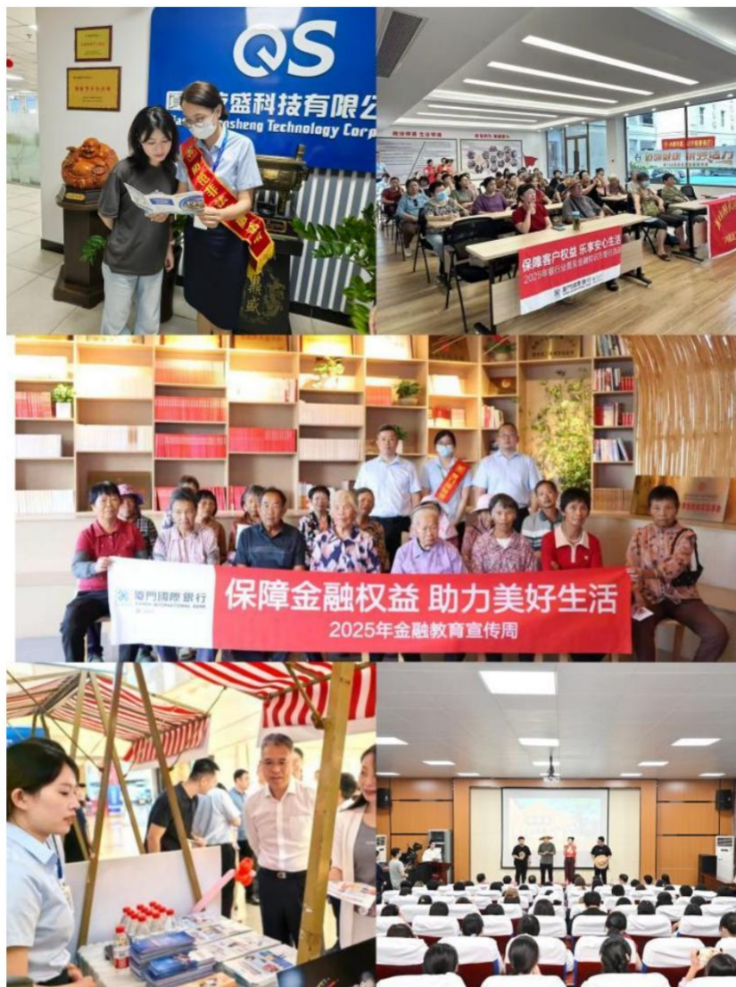
图注：2025 年，我行举办金融教育宣传进企业、进社区、进农村、进商圈、进校园活动

信公众号、官网发布原创推文及风险提示 44 篇；拍摄防范非法中介公益宣传片，获评厦门市银行业协会优秀宣传视频，切实提升消费者风险防范意识。三是持续完善宣传阵地，优化手机银行消保专栏，强化网点“公众教育专区”“消保专栏”建设，推动金融知识普及触达更广人群。