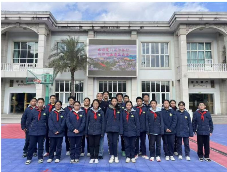
图注：上海分行向上海共康中学西藏班贫困生提供“闽都-集友陈嘉庚奖助学金”