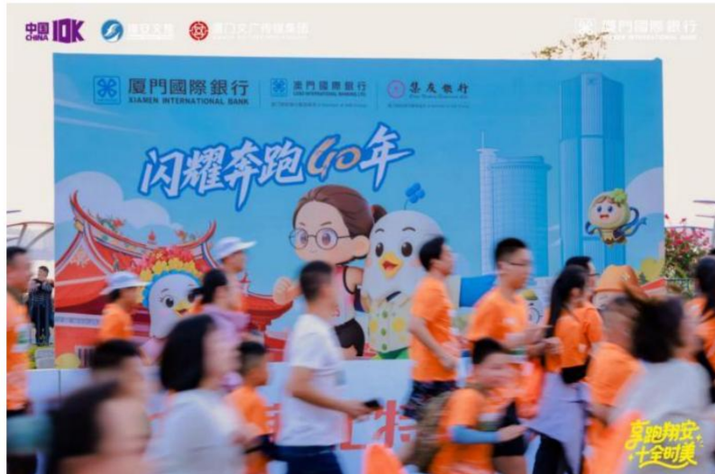
图注：以 40 周年为契机总冠名中国田径协会 10 公里精英赛（厦门·翔安站），助力全民健身，弘扬时代正能量