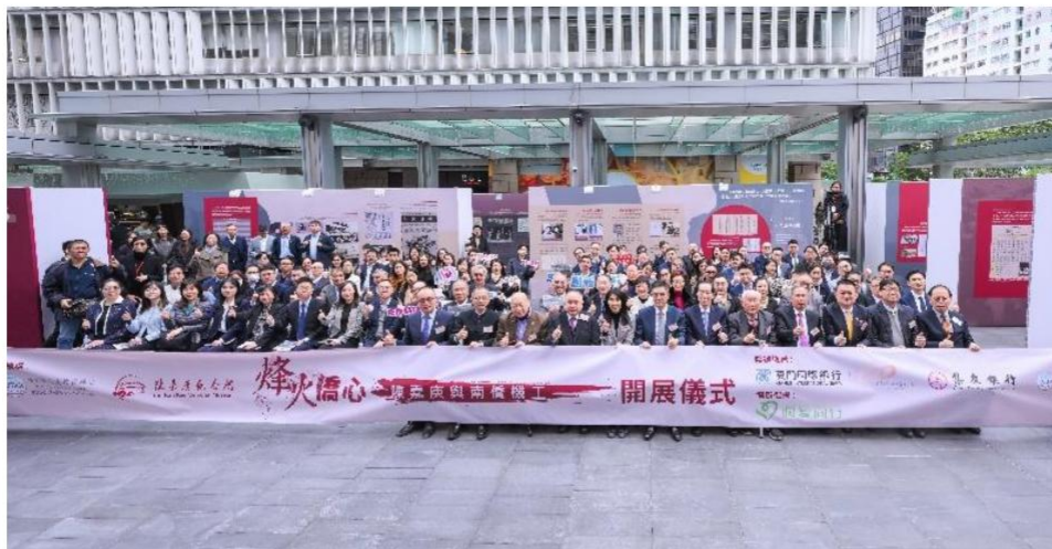
图注：2025 年，我行参与联办“烽火侨心——陈嘉庚与南侨机工”展览，在厦门、香港、上海和马来西亚吉隆坡四地联展