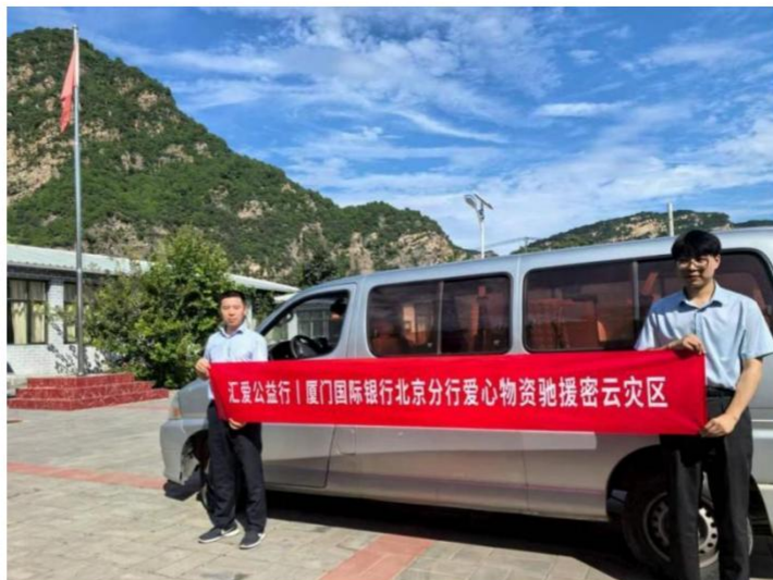
图注：北京分行筹措生活物资送往密云灾区