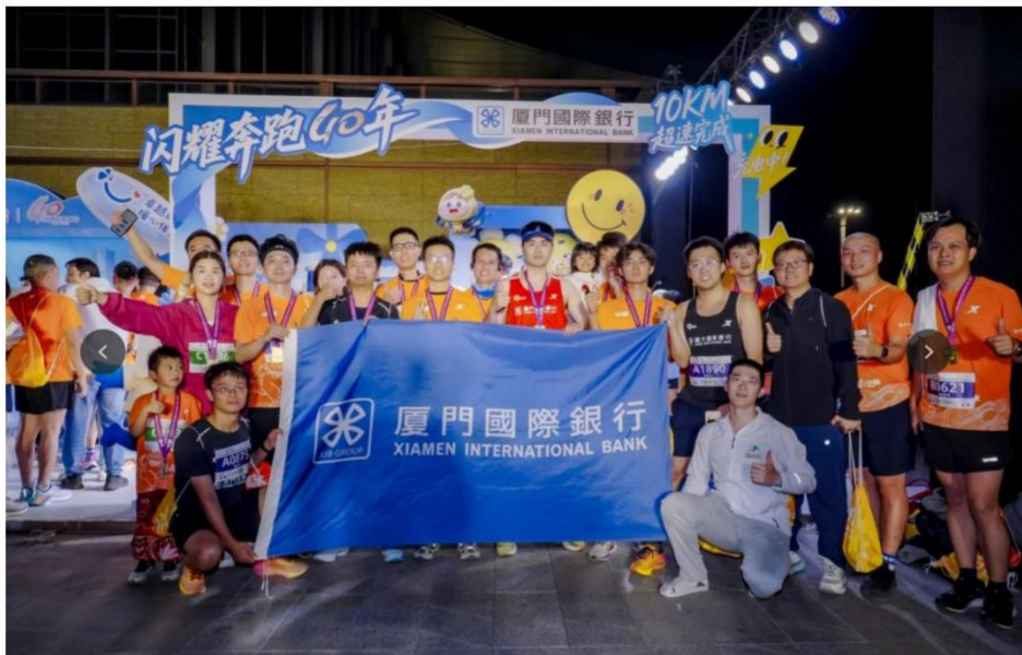
图注：2025 年 11 月，我行在总冠名中国田径协会 10 公里精英赛（厦门·翔安站）上推出“微笑加油站”品牌展

越服务 暖心伴您”服务品牌体系，在银行总冠名的中国田径协会 10 公里精英赛（厦门·翔安站）上推出“微笑加油站”品牌展，搭建起贴近市民和群众的金融服务沟通桥梁，把金融消费者权益保护理念传递给广大市民。