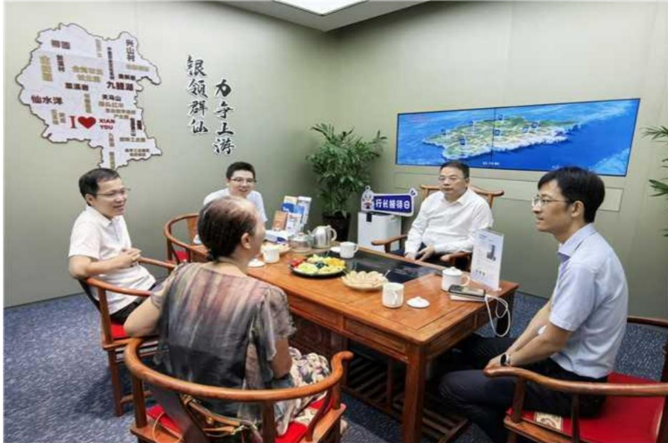
图注：2025 年，我行建立各级机构负责人接待日工作机制

听和协调解决消费者诉求，全年累计开展接待日活动近千场次；各家分行积极推进与属地第三方纠纷调解机构建立合作关系，珠海分行在分行营业部设立“基层调解服务站”，北京分行在营业网点建立“枫桥工作站”，用于纠纷调解。