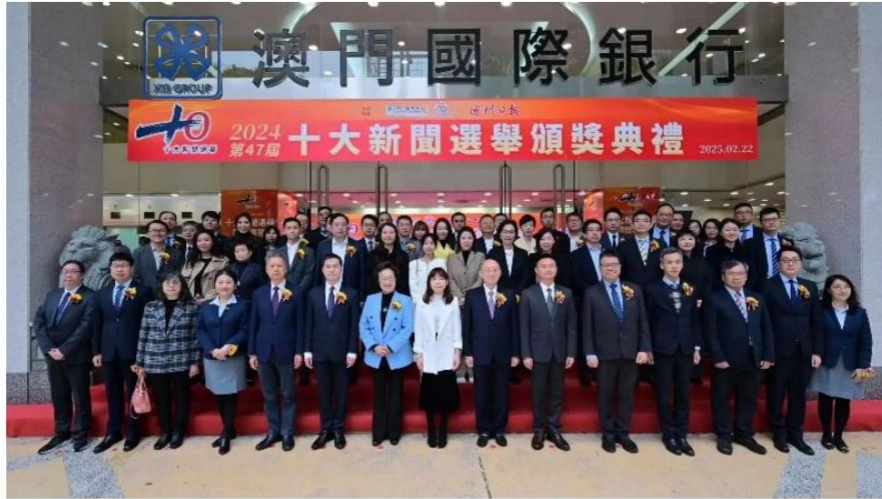
图注：澳门国际银行联合澳门日报成功举办第 47 届“十大新闻选举”