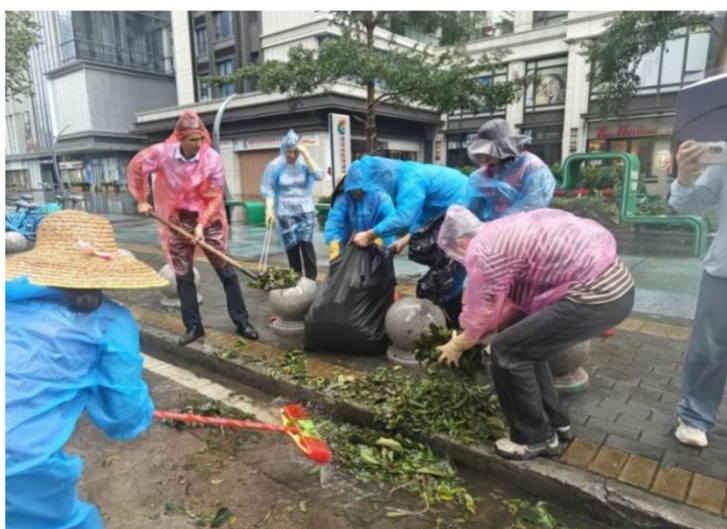
图注：珠海分行组织多批次党员志愿者开展台风清淤复建工作