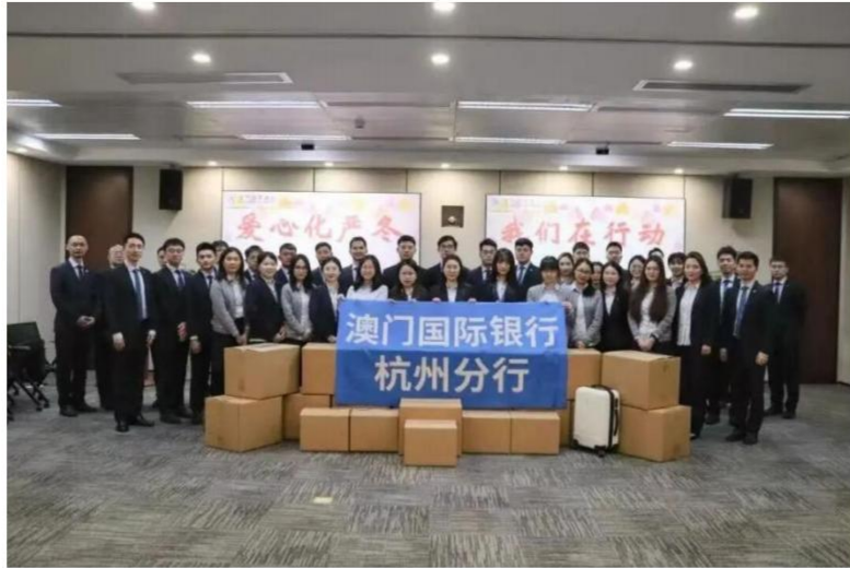
图注：澳门国际银行募集爱心物资定向捐赠四川甘孜稻城亚丁山区儿童